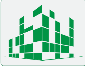
شركة قصور قرطبة للمقاولات Cordoba Palaces Contracting Company